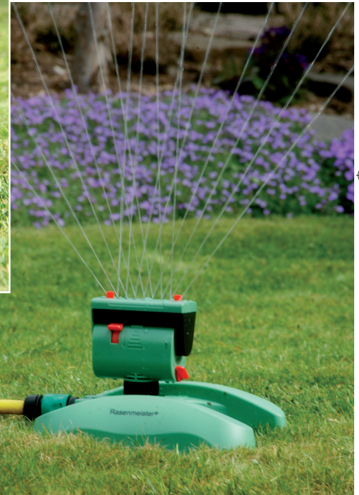
In der kompakten Ausführung können zwei Düsenreihen separat eingestellt werden

Das Wichtigste bei der Rasenbewässerung ist die richtige Wassermenge, die gleichmäßig auf der Fläche zu verteilen ist. Dazu ist es erforderlich, dass die Wassermenge und die beregnete Fläche eingestellt werden können. Bei beiden hier vorgestellten Ausführungen sind diese Möglichkeiten gegeben. In beiden Fällen wird die Schwenkbewegung durch Wasserdruck erzeugt.